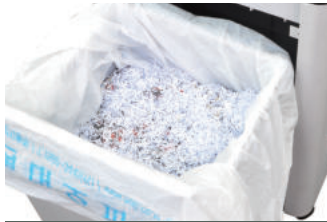
규격: 중형 | 크기: 700X750mm