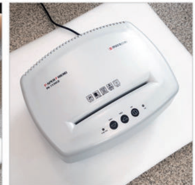
⑤ 분리된 헤드만 따로 포장해서서 보내주시면 됩니다.