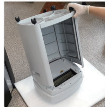
④ 위 사진과 같이 헤드를 분리해줍니다.