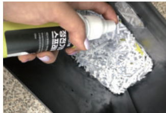
정전기방지 스프레이 100ml